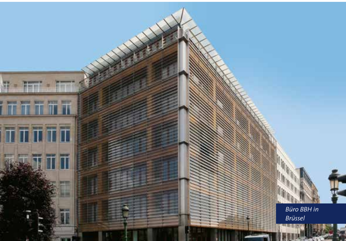
Büro BBH in Brüssel

AGN International ist eine Vereinigung von selbstständigen und unabhängigen Wirtschaftsprüfungs- und Steuerberatungsgesellschaften mit rund 200 Mitgliedern aus fast 100 Ländern.