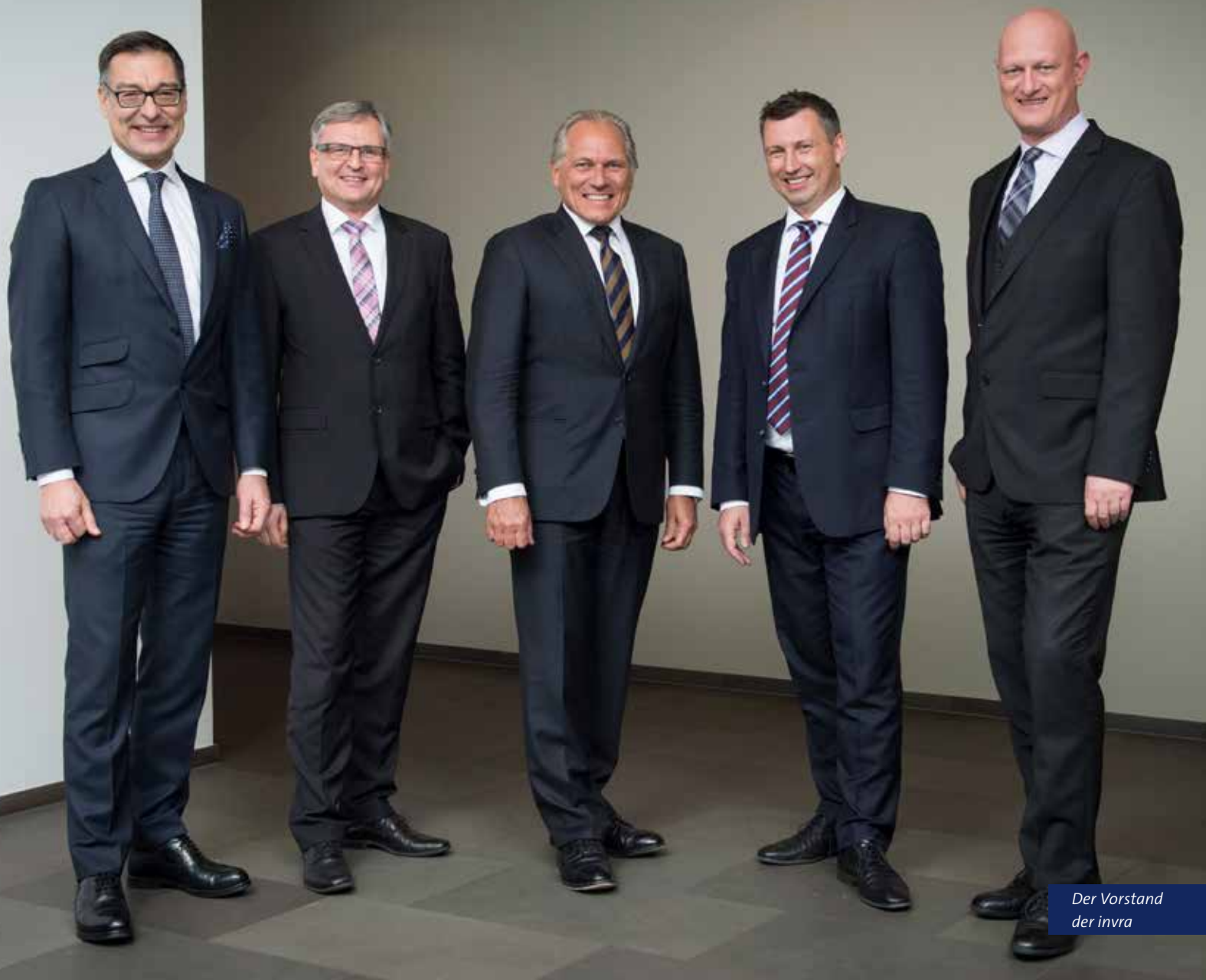
Der Vorstand der invra